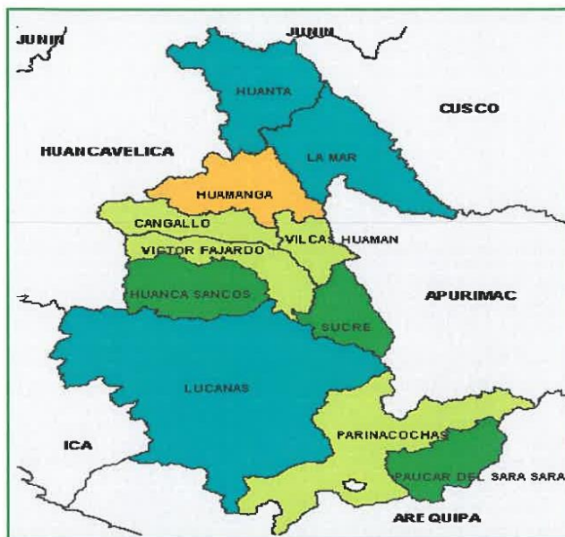
PROVINCIA DE HUAMANGA