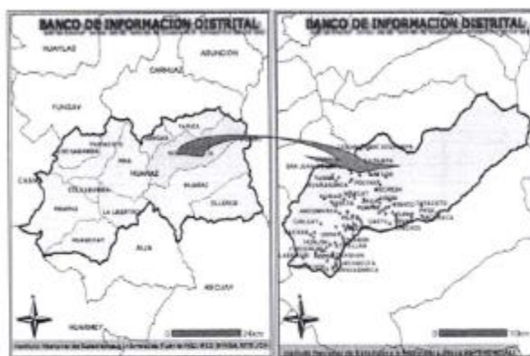
Micro Localización del Proyecto Figura N° 1.2