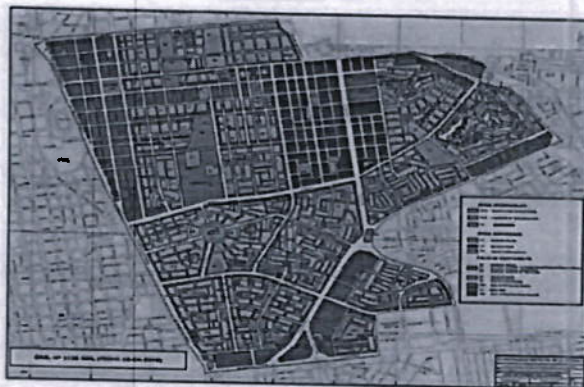
IMAGEN N° 02

"Año de la recuperación y consolidación de la economía peruana"