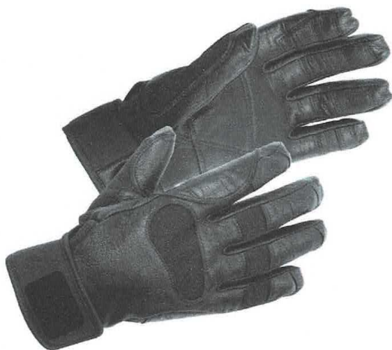
IMAGEN REFERENCIAL DEL BIEN:

DESCRIPCIÓN GENERAL: Guantes de cuero para técnicas de rapel, evitando la fricción de las manos con la cuerda y lesiones que pudiera causar, ya que el rapel es un sistema de descenso por superficies verticales y descenso autónomo.