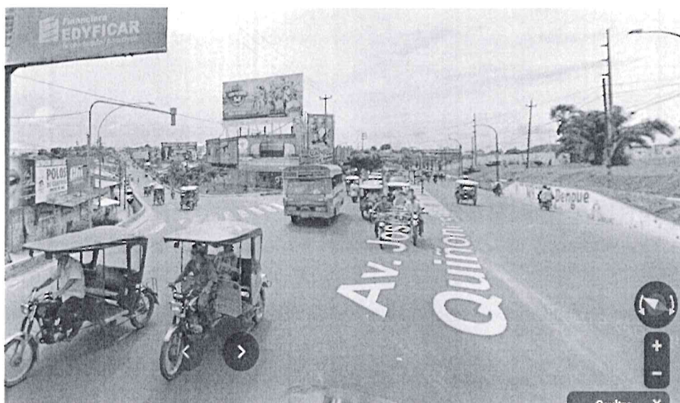
CRUCE DE LA AV. QUIÑONES CON LA AV. PARTICIPACION