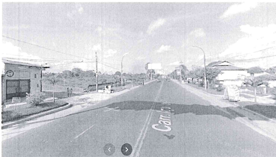
VISTA DE LA AV. ABELARDO QUIÑONES KM 5+905