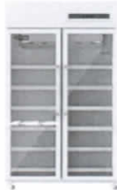
REFRIGERADORA PARA LABORATORIO CON PUERTA DE CRISTAL MRF/L1000

( https://laboratorio.cimmsa.pe/producto/refrigeradora-para-laboratorio-con-puerta-de-cristal-mrf-l1000/ )