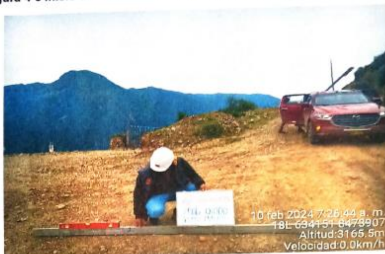
Tabla 4-2 Ubicación Geográfica – Fin de Tramo: RIO PAMPAS (PTE. PISHCO)