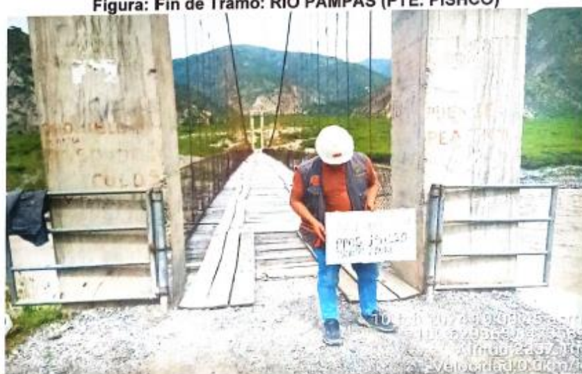
Figura: Fin de Tramo: RIO PAMPAS (PTE. PISHCO)