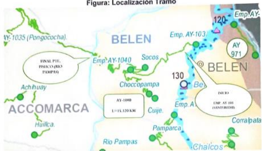
Tabla: Ubicación Geográfica – Inicio de Tramo (AY-1040; final TRAMO: EMP. AY-105