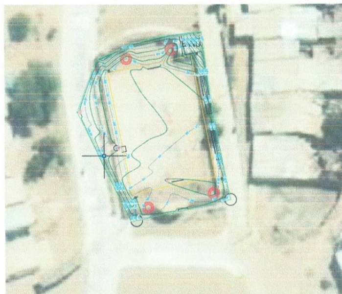
GRÁFICO N° 1: Micro localización del servicio

El área de macro localización está definida por el Distrito de Ignacio Escudero Provincia de Sullana, que es una provincia del noroeste del Perú situada en la parte en la carretera panamericana norte Sullana-talara. Limita con el Distrito de Marcavelica por el Norte, con el Distrito de tamarindo por el Oeste, con los Distritos de Marcavelica por el Este y con el rio chira por el Sur.