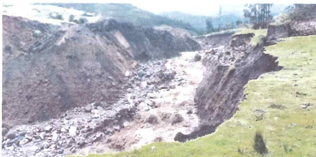
FOTO N° 04: Se aprecia desfogue del río por terrenos agrícolas, afectando sembríos.