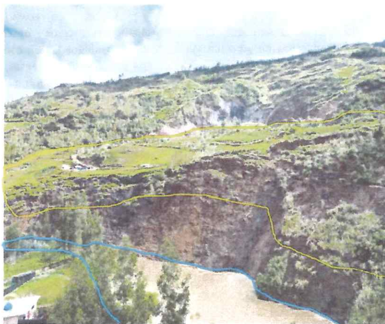
FOTO N° 02: Se aprecia asentamiento del terreno y represamiento del agua a causa de la compactación.

AV. ABELARDO GAMARRA RONDO S/N (PLAZA DE ARMAS) - SARIN - SANCHEZ CARRION - LA LIBERTAD