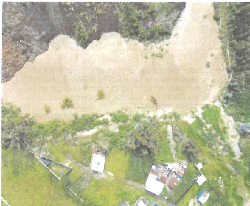
FOTO N° 03: Represamiento del agua que pone en peligro las viviendas que se encuentran a la ribera del río.