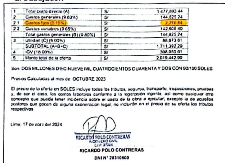
Imagen del precio de la oferta del postor a folio 12