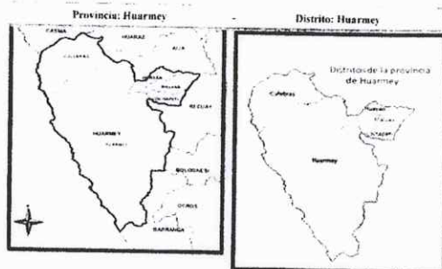
UBICACIÓN DEL PROYECTO

MUNICIPALIDAD PROVINCIAL DE HUARMEY CONTRATACIÓN PARA LA EJECUCIÓN DE LA OBRA "MEJORAMIENTO DEL SERVICIO DE RIEGO DEL CANAL LATERAL REYNALTE - HUAMBA ALTA DEL DISTRITO DE HUARMEY - PROVINCIA DE HUARMEY - DEPARTAMENTO DE ANCASH" con código único de inversiones (CUI) N° 2474776