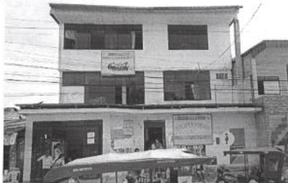
Vista 01 / Fachada principal de C-S I- 3 La Carretera - Yurimaguas.

El proyecto de inversión a ser formulado se ha denominado preliminarmente como: MEJORAMIENTO DEL SERVICIO DE ATENCIÓN DE SALUD BÁSICOS EN C.S. I-3 CARRETERA KM 1.5 DE CENTRO POBLADO YURIMAGUAS DISTRITO DE YURIMAGUAS DE LA PROVINCIA DE ALTO AMAZONAS DEL DEPARTAMENTO DE LORETO