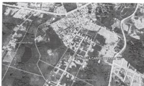
Esquema 01 - Ubicación del terreno donde se desarrollará el proyecto del C.S. I-3 LA CARRETERA es Jr. Los Libertadores

Para llegar al terreno donde se pretende construir el C.S. I-3 LA CARRETERA, es por la carretera Yurimaguas - Tarapoto y la carretera a Simuy via terrestre