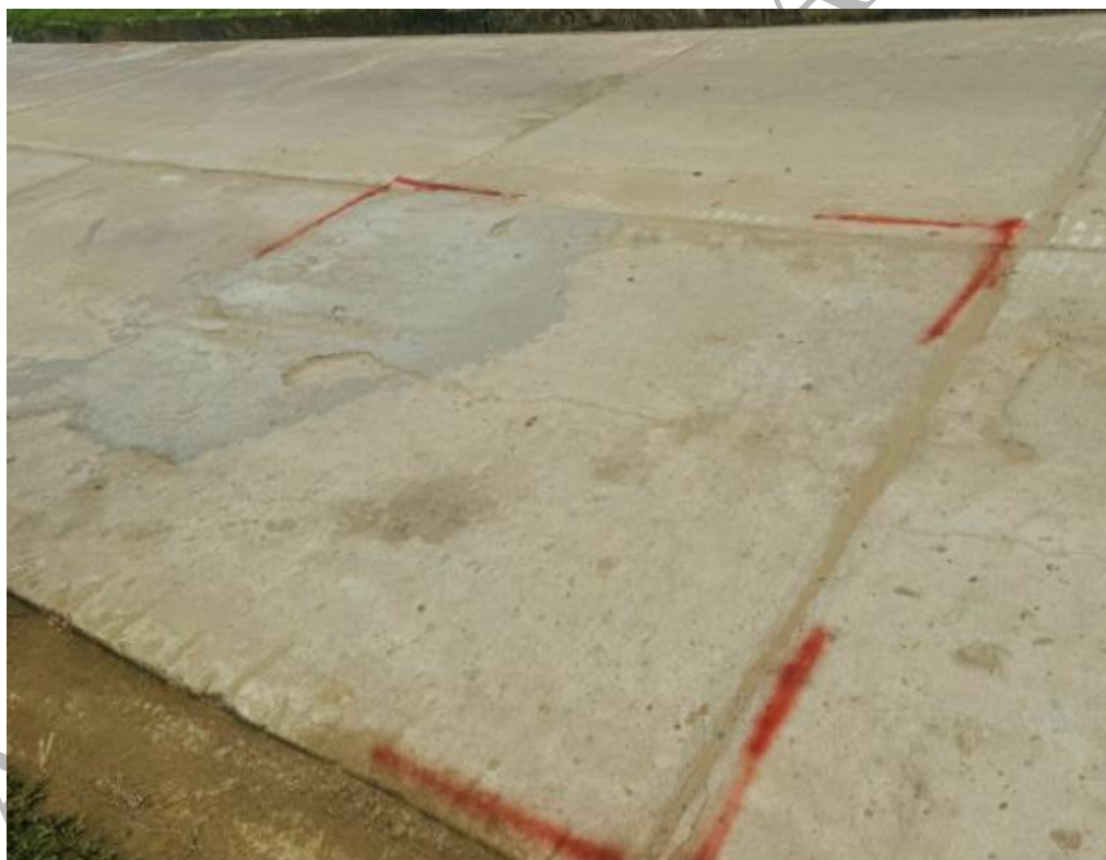
FOTO N°03: Se aprecia vista panorámica del pase de motocarros con elevado riesgo.