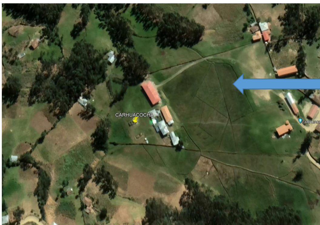
Ubicación Geográfica del lugar donde se proyecta la edificación.

Imagen N° 1: Ubicación y localización (9°09'09.00 N, 222°58'00 E)