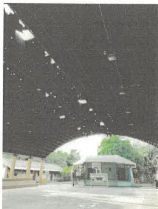
VISTAS DE LA SITUACION ACTUAL DE LA INSTITUCION EDUCATIVA