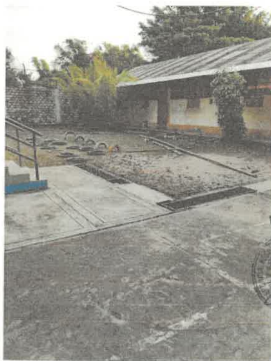
VISTAS DE LA SITUACION ACTUAL DE LA INSTITUCION EDUCATIVA