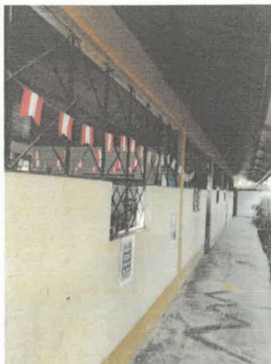
VISTAS DE LA SITUACION ACTUAL DE LA INSTITUCION EDUCATIVA