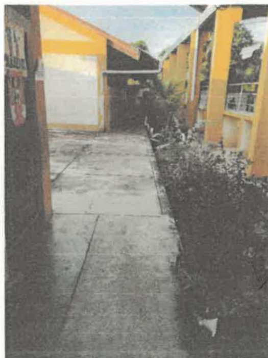
VISTAS DE LA SITUACION ACTUAL DE LA INSTITUCION EDUCATIVA