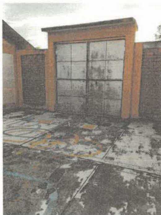
VISTAS DE LA SITUACION ACTUAL DE LA INSTITUCION EDUCATIVA