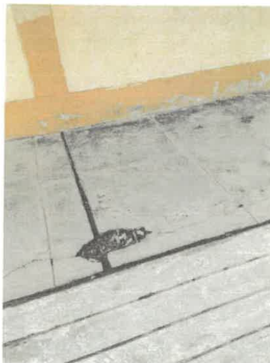
VISTAS DE LA SITUACION ACTUAL DE LA INSTITUCION EDUCATIVA