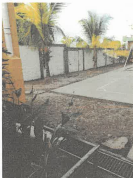
VISTAS DE LA SITUACION ACTUAL DE LA INSTITUCION EDUCATIVA