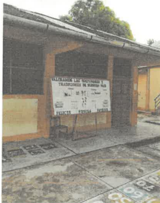
VISTAS DE LA SITUACION ACTUAL DE LA INSTITUCION EDUCATIVA