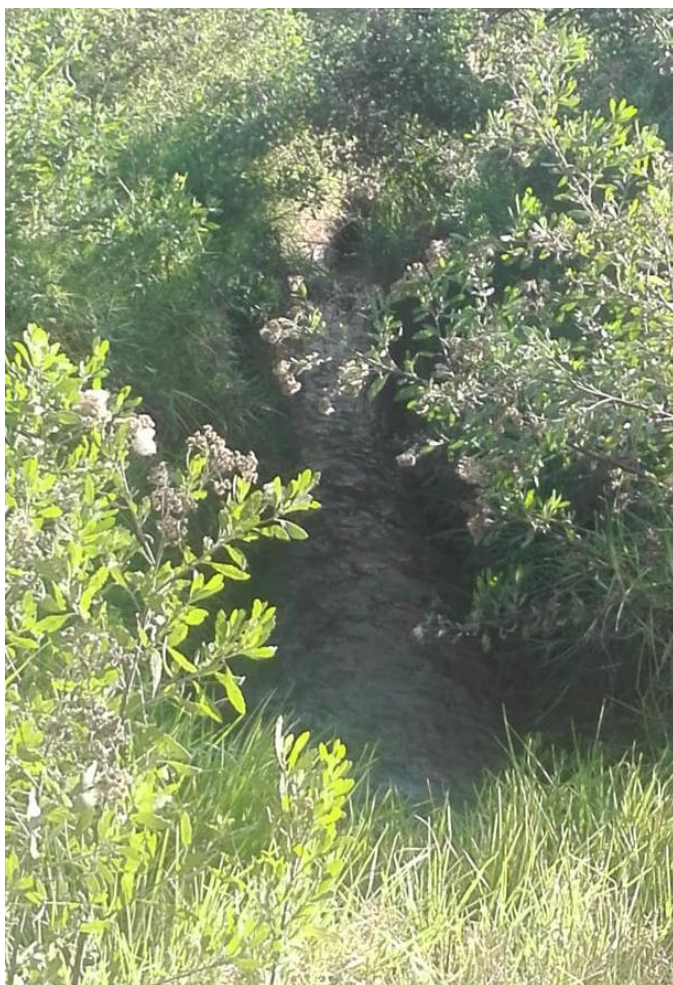
Imagen N°02: Estado actual del canal

Finalmente, con el objetivo de reconocer las necesidades y los intereses de la población objetivo (50 usuarios) se analizaron sus aspectos sociales, culturales y económicos. El objetivo del diagnóstico buscó identificar un listado de problemas y oportunidades en el área objeto del diagnóstico.