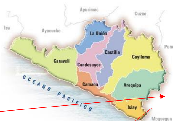
Mapa del Arequipa