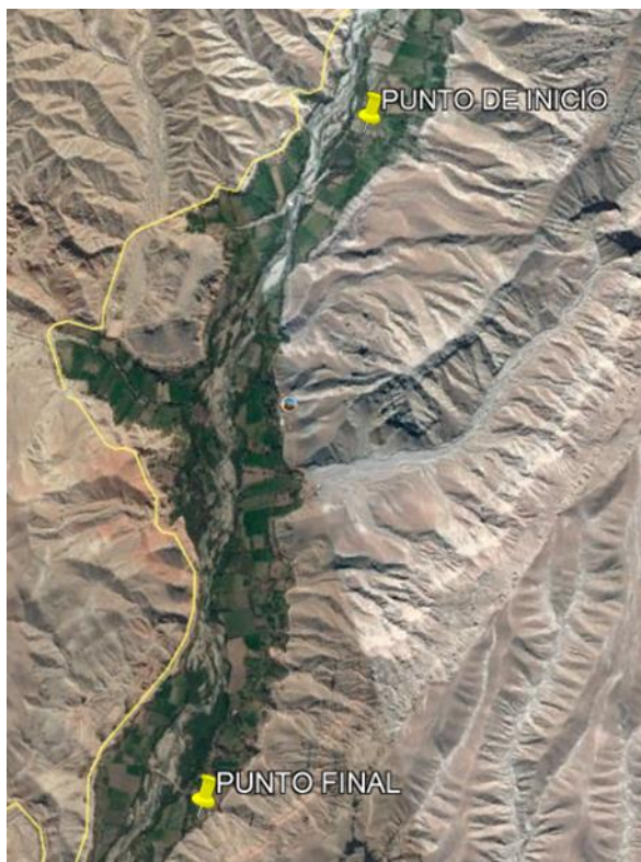
Imagen N°01: Ubicación del proyecto.