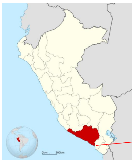
Mapa del Perú