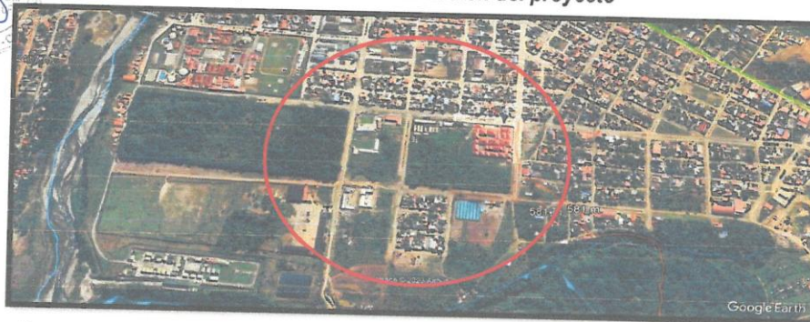
Mapa N° 2 Micro Localización del proyecto