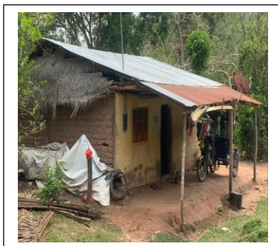
Vivienda de Barro: Estructuras rústicas, conformadas por muros de barro, de dos niveles con techo de madera y cobertura liviana de calamina o paja seca.

Las viviendas dentro del área de influencia del proyecto son casi en su totalidad, de características propias de la Región San Martín (Selva), en número mínimo existen viviendas modernas de material noble, a continuación, se mencionarán los tipos de viviendas existentes según el material predominante: