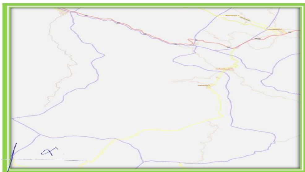
Mapa Satelital de la Localidad de Huimba Muyuna