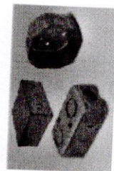
FIGURA 4: CAJAS METÁLICAS GALVANIZADAS