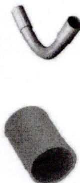
FIGURA 3: TUBERÍA LIBRE DE HALÓGENOS.

"Año del Bicentenario del Perú: 200 años de Independencia" UNIVERSIDAD NACIONAL MAYOR DE SAN MARCOS Universidad del Perú, Decana de América