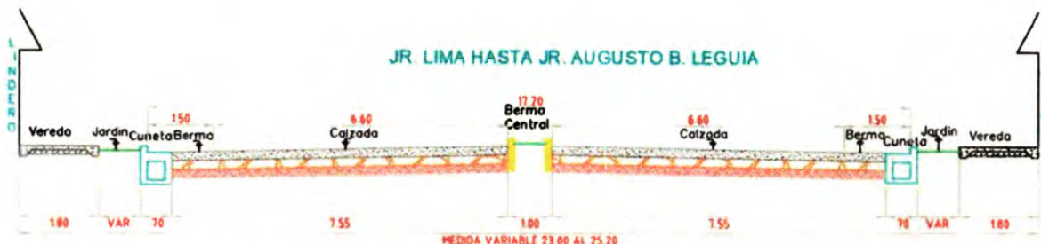
Sección típica del Jr. Mollendo (Entre Av. Jhon F. Kennedy y Jr. Augusto B. Leguía)

Con respecto a la determinación de los niveles de excavación, se ha efectuado el trazo de la sub-rasante con la finalidad de mantener en lo posible una medida cercana al nivel de trazo existente, así como proveer posibles deterioros involuntarios de viviendas, ello permitirá evitar demasiados cortes para el movimiento de tierras, así como también cuidar en el otro extremo que la vía resulte demasiado alta para su normal funcionamiento.