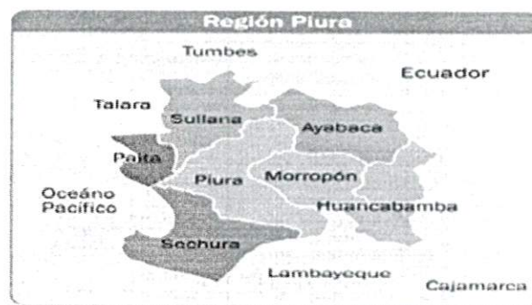
Imagen N° 01

Piura es una provincia del noroeste del Perú situada en la parte central del Departamento de Piura. Limita con la Provincia de Paita y de Sullana al Noroeste, con las de Ayabaca, Morropón y Lambayeque por el este, y con la Sechura por el suroeste. Su capital es la ciudad de Piura.