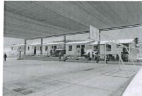
VISTAS DE LA I.E. MARISCAL GILLERMO MILLER