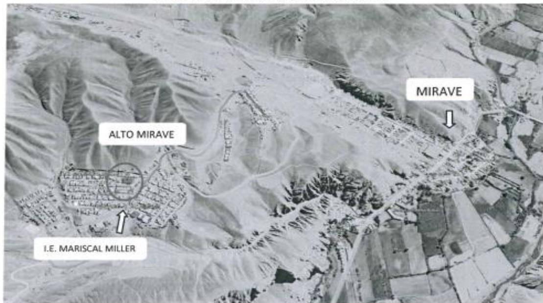
Gráfico N° 01: I.E. MARISCAL MILLER MIRAVE

El área de estudio del proyecto de inversión tiene como un punto de referencia la I.E. MARISCAL GUILLERMO MILLER.