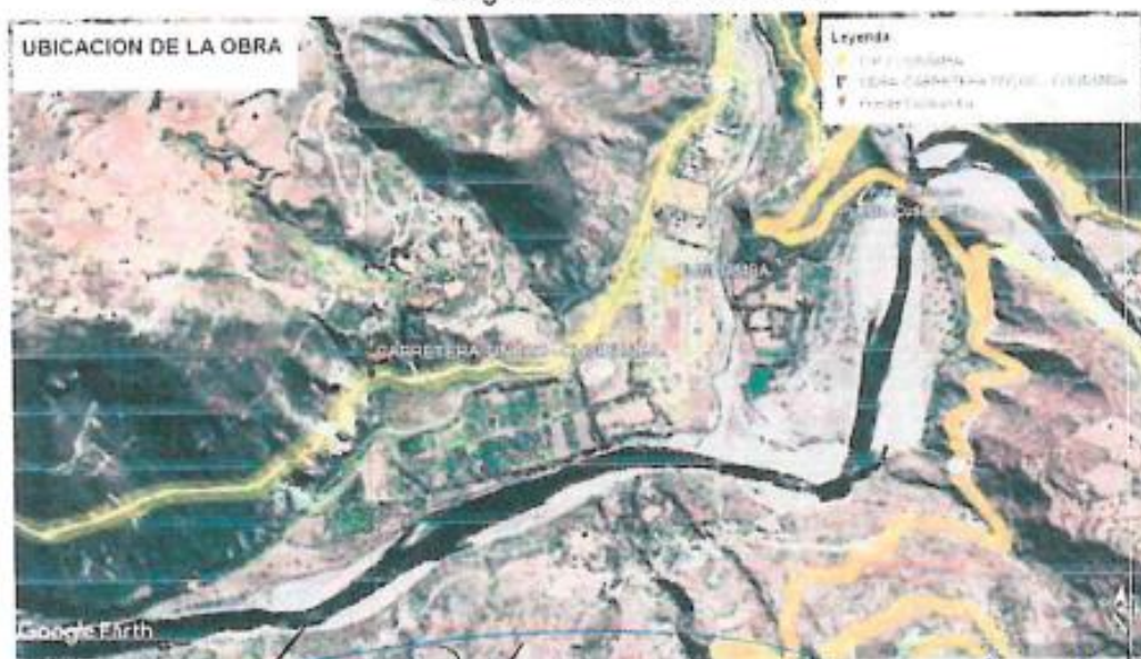
Imagen: Ubicación de la Obra.