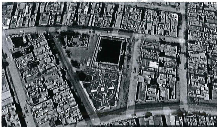
MICRO LOCALIZACION (DISTRITO DE NUEVO CHIMBOTE - PARQUE MULTIUSOS EN LA URB. CASUARINAS II ETAPA)