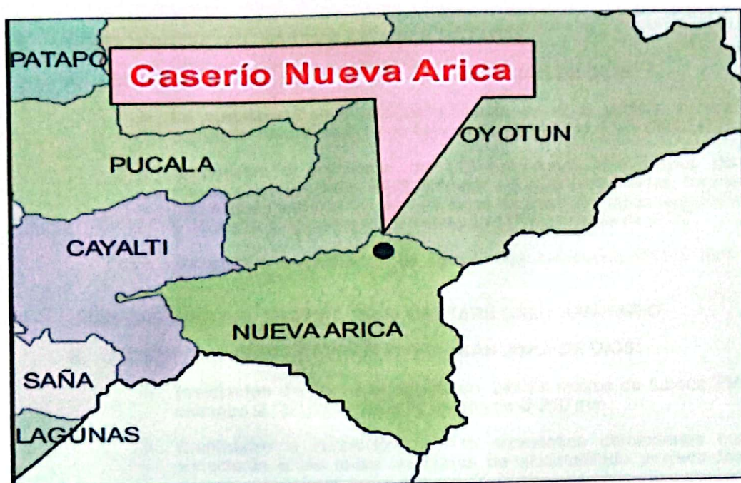
Gráfico N.º 01: Localización del Proyecto en el distrito Nueva Arica.