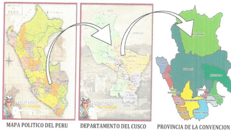
IMAGEN N° 01: ZONA DE INTERVENCIÓN-CC.NN. CAMISEA