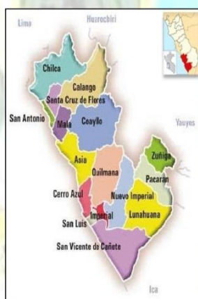
Imagen 1.2. Provincia de CAÑETE