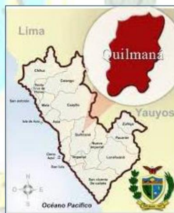
Imagen 1.3. Distrito de QUILMANA