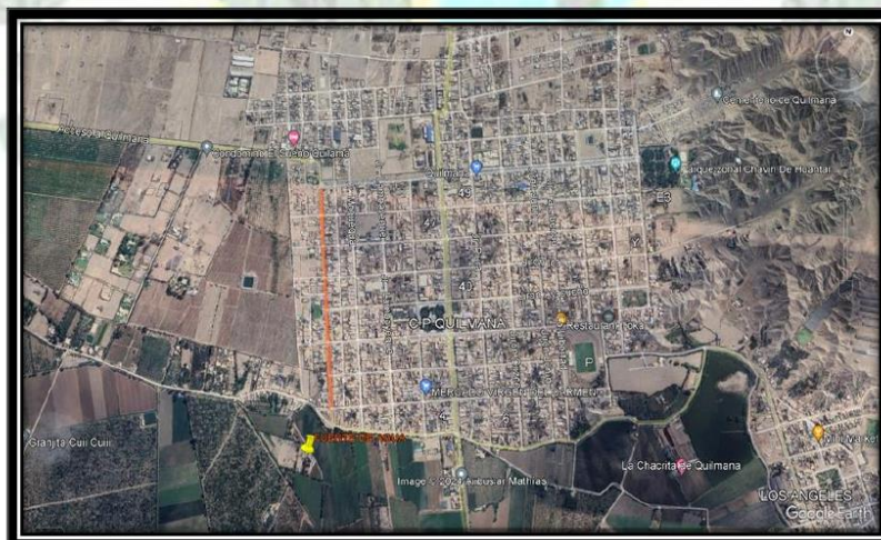
Imagen 1.8. Ubicación de la fuente de agua