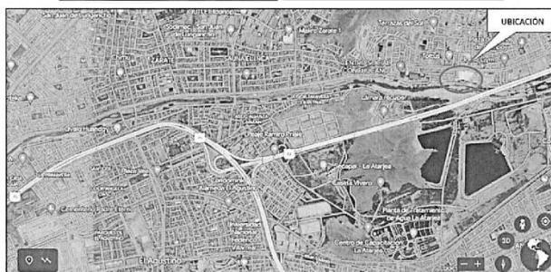
Imagen 1: Ubicación del proyecto en el Distrito de San Juan de Lurigancho.