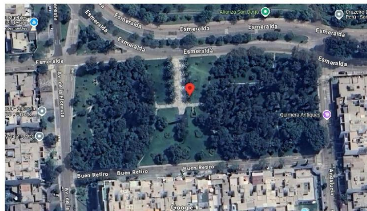
Figura N° 02: Parque Aramburú y Salinas