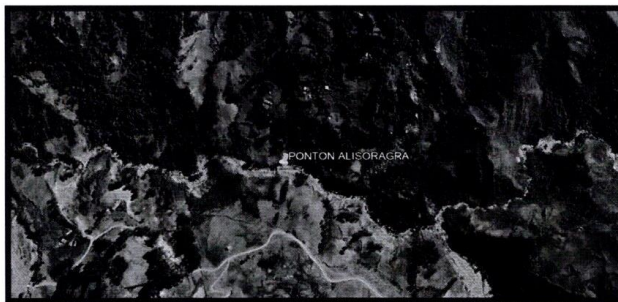
Lugar de ejecución de la Actividad.