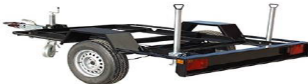
IMAGEN REFERENCIAL DE REMOLQUE