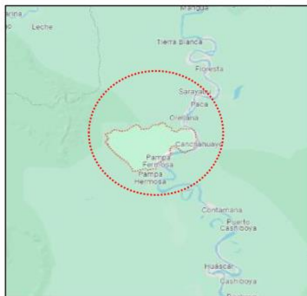
Imagen: Mapa Distrito de INAHUAYA

"ADQUISICION DE GRUPO ELECTROGENO; RENOVACION DE CASA DE FUERZA; EN EL (LA) SISTEMA ELECTRICO EN LA LOCALIDAD DE JOSE OLAYA, CENTRO POBLADO JOSE OLAYA, EN EL DISTRITO DE INAHUAYA, PROVINCIA UCAYALI DEPARTAMENTO LORETO"