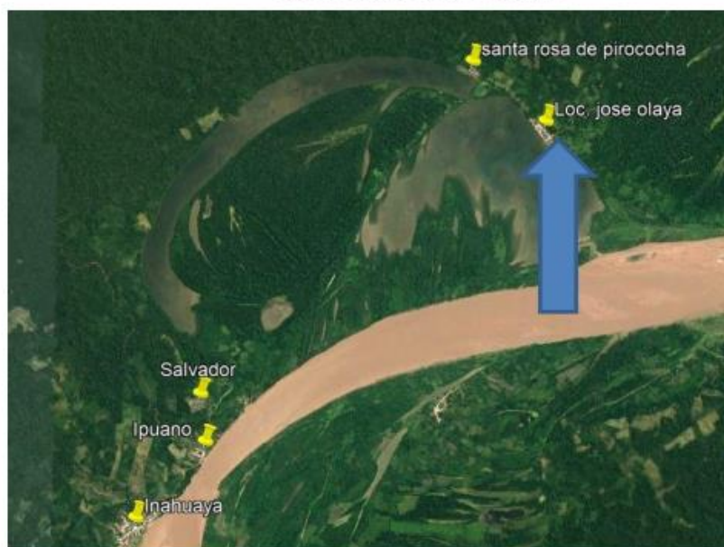
Vista satelital de la localidad de José Olaya

El acceso desde la ciudad de Pucallpa hasta el centro Poblado de José Olaya y hasta el lugar de la obra, es el siguiente: