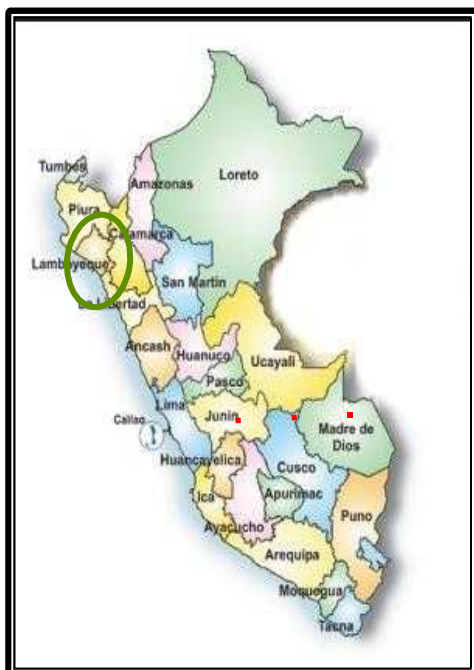
GRÁFICO N° 01. Ubicación del C.P. Pacherez