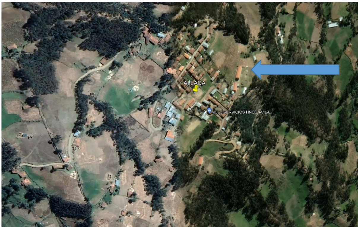
Ubicación Geográfica del lugar donde se proyecta la edificación.

Imagen N° 1: Ubicación y localización (9°102,465.00 N, 219,110.00 E)