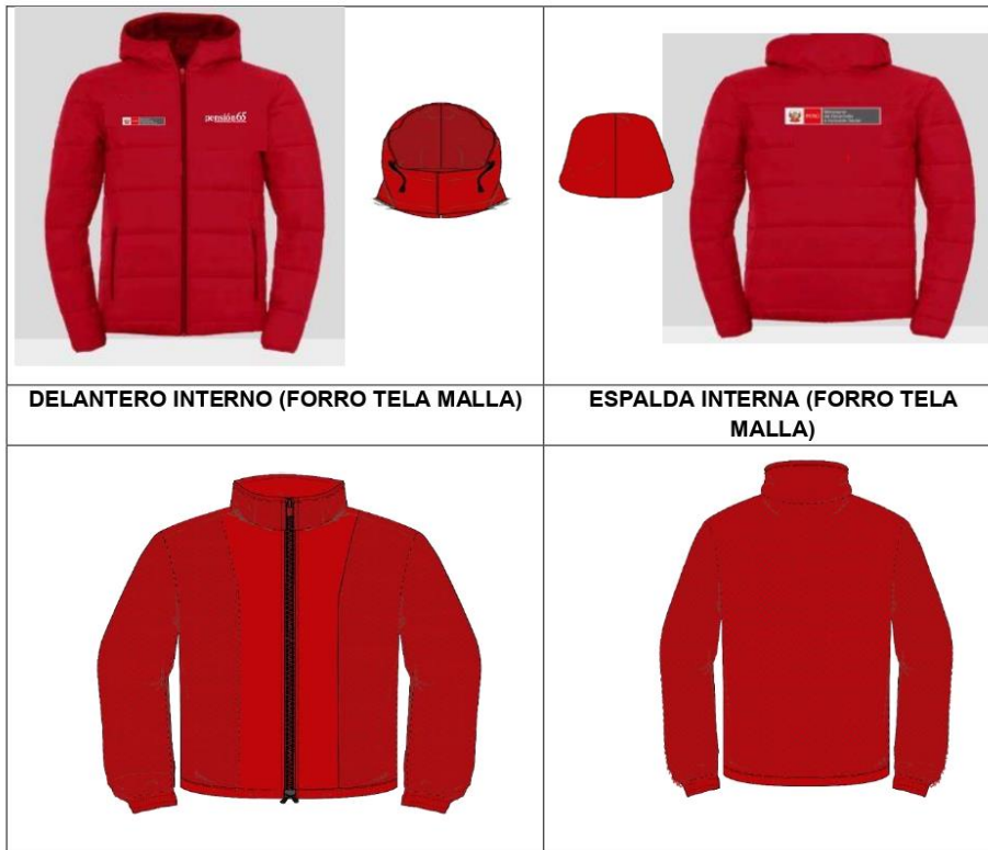
DELANTERO INTERNO (FORRO TELA MALLA)

"Año del bicentenario, de la consolidación de nuestra independencia y de la conmemoración de las heroicas batallas de Junín y Ayacucho"