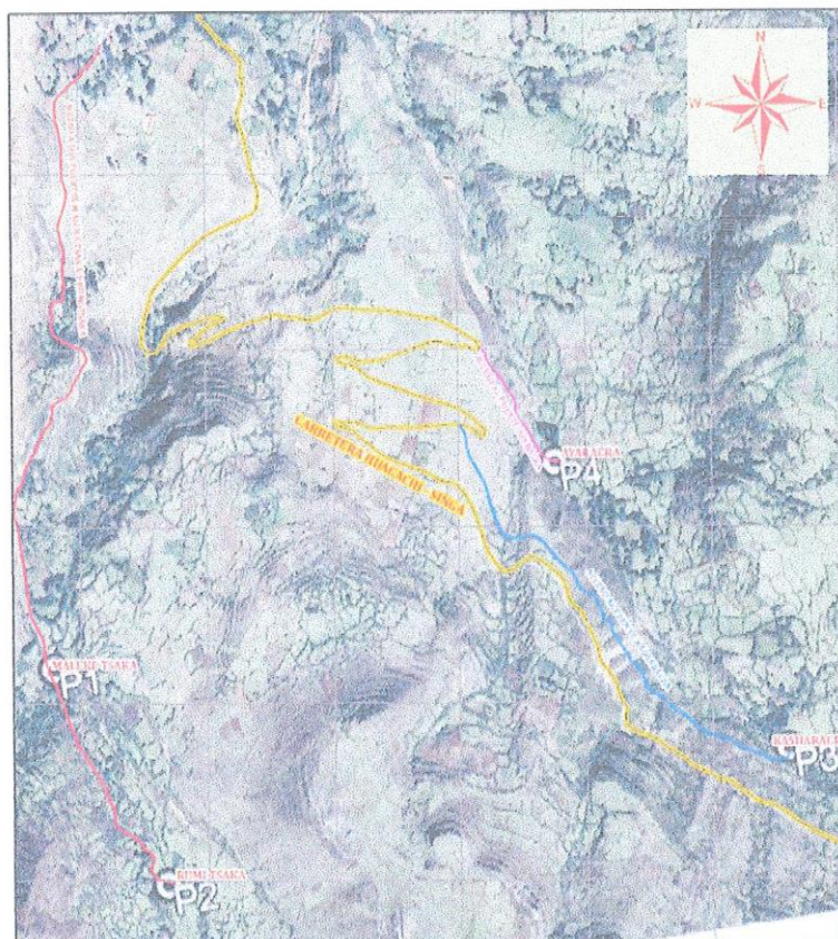
Lugar del proyecto.