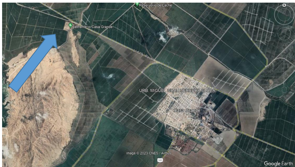
Ubicación Geográfica del lugar donde se proyecta la edificación.

“CONSTRUCCION DE NICHOS; EN EL(LA) CEMENTERIO MUNICIPAL CASA GRANDE DISTRITO DE CASA GRANDE, PROVINCIA ASCOPE, DEPARTAMENTO LA LIBERTAD” CUI 2576358”