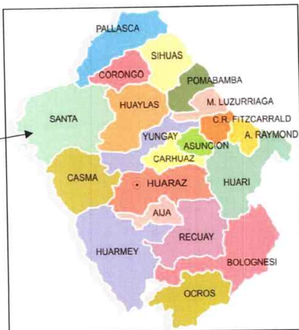
DEPARTAMENTO DE ANCASH