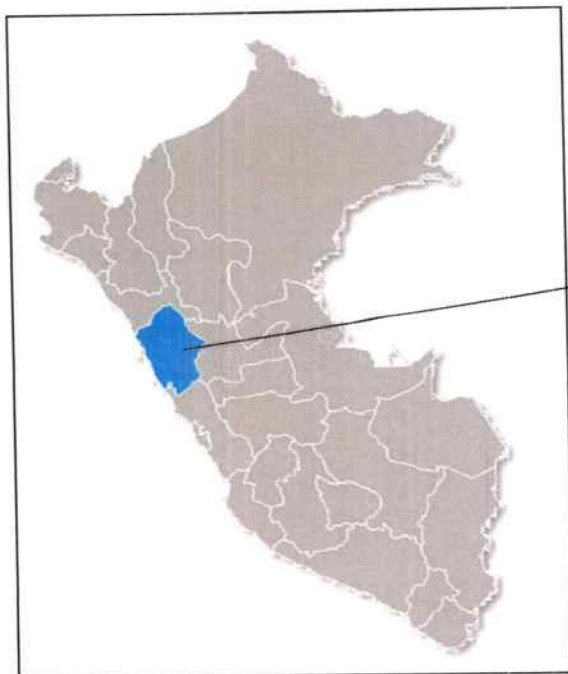
MAPA DEL PERÚ