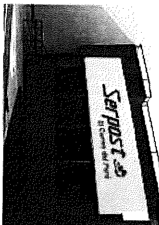
FACHADA DE COLOR DE LA BOUTIQUE PUNTA NA MISION TCOM VALLE ALMACEN A NUESTROS SERVICIOS