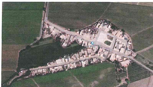
Imagen N°01: Ubicación del Proyecto