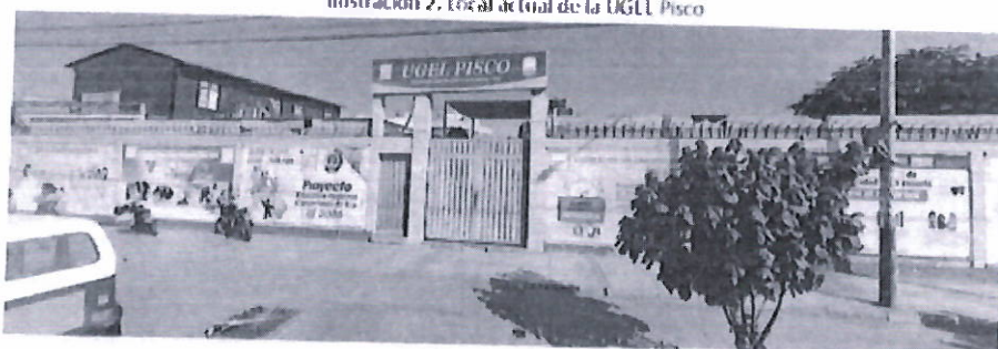
Ilustración 2: Local actual de la UGEL Pisco