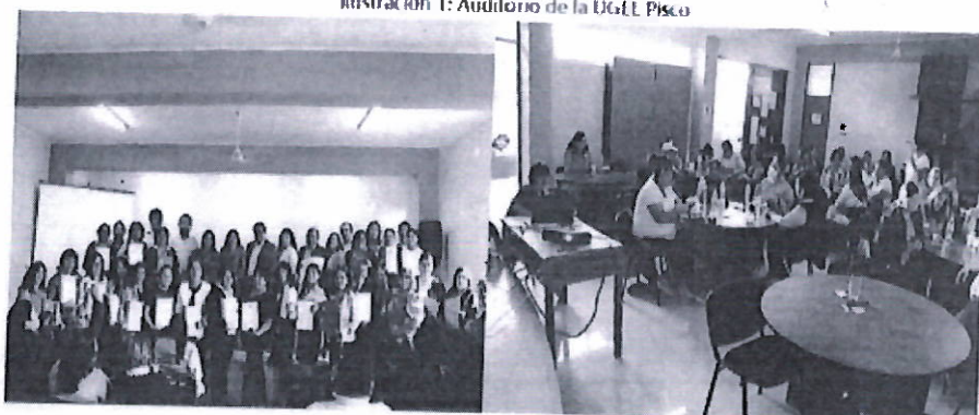
Ilustración 1: Auditorio de la UGEL Pisco