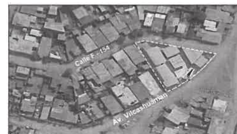
Figura N°1: Ubicación de la I.E. N°156.

El perfil del proyecto indica que se construirán las siguientes áreas: