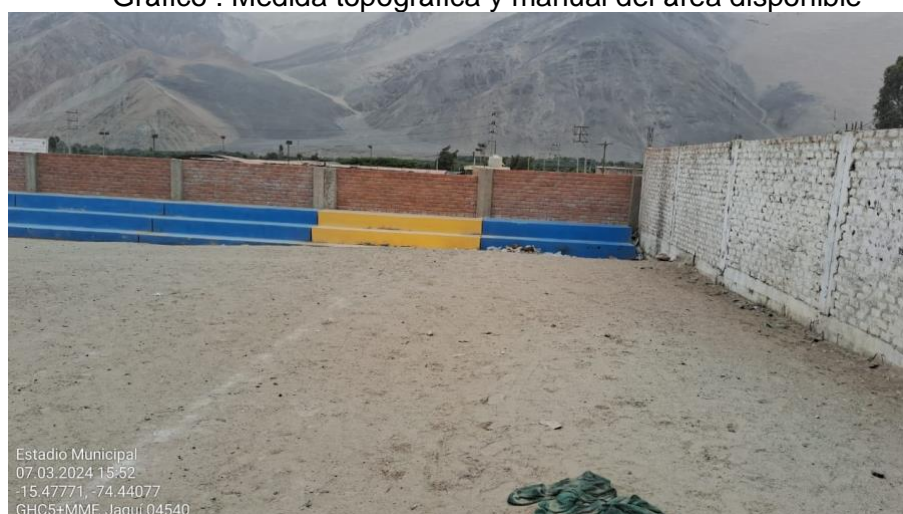
Gráfico : Medida topográfica y manual del área disponible

En consecuencia, el área en cuestión (Estadio de Jaqui), no tiene un servicio adecuado a los pobladores de la zona, teniendo la necesidad de hacer las reparaciones y construcciones pertinentes para un uso adecuado y en bien de la sociedad.