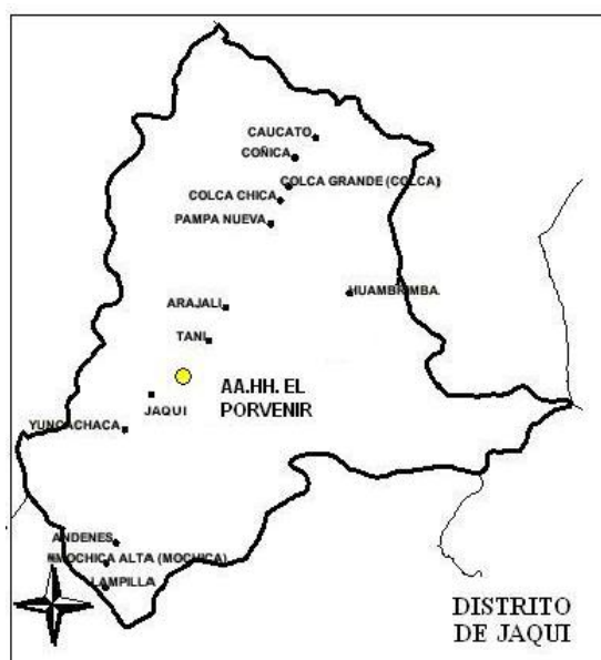
CENTROS POBLADOS DE JAQUI