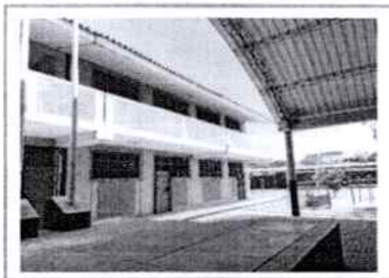
PARELLÓN EXISTENTE DE AGUAS DE LA I.E. - MATERIAL NOBLE

lluvias intensas, sismos que dependiendo de la magnitud pueden generar daños en la población y la diversa infraestructura pública tal como ocurrió con el sismo ocurrido el 30 de julio del año 2021 que tuvo como epicentro a la provincia de Sullana de magnitud 6.1 a una profundidad de 32KM teniendo como epicentro al distrito de Ignacio Escudero.