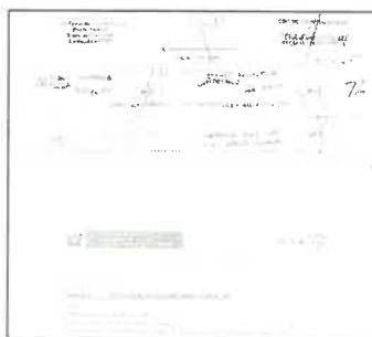
Imagen pág. 72 y 73