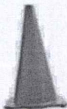
CONO DE SEGURIDAD