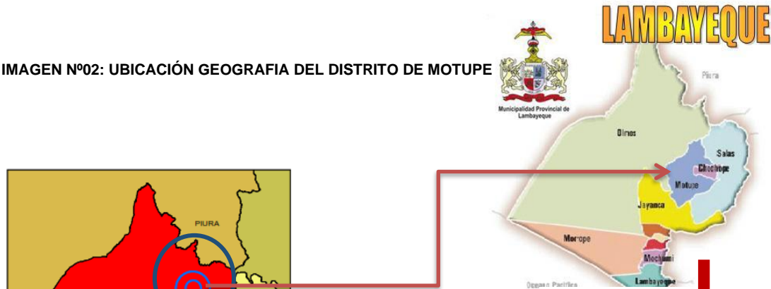
IMAGEN Nº02: UBICACIÓN GEOGRAFIA DEL DISTRITO DE MOTUPE