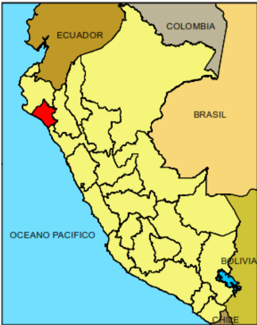
IMAGEN Nº01: LOCALIZACIÓN GEOGRÁFICA DE LA REGIÓN LAMBAYEQUE