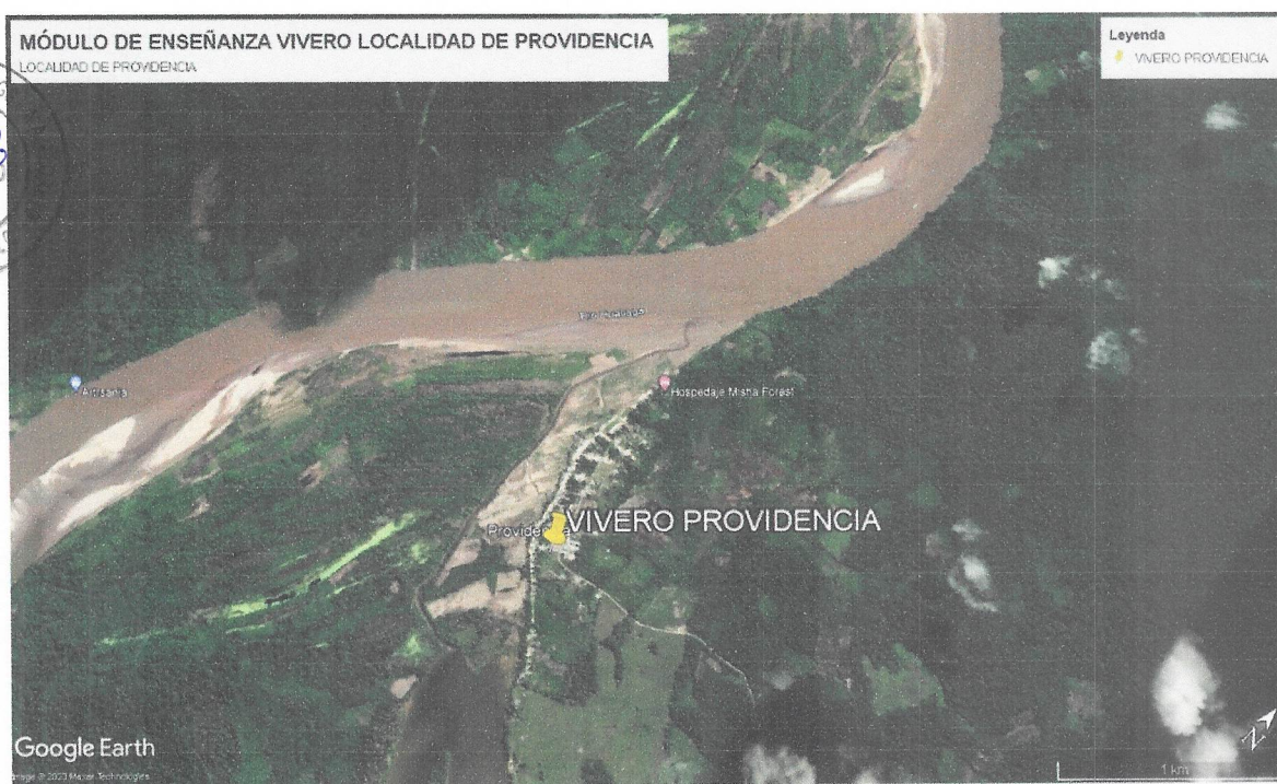
Figura 01: Ubicación de módulo de vivero – Localidad Providencia