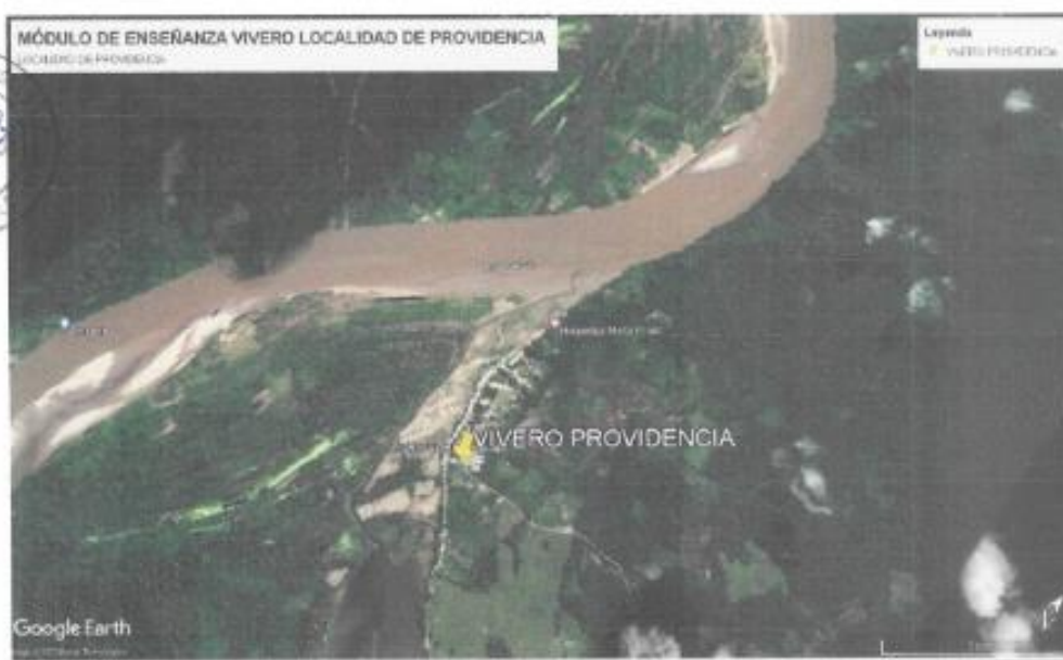
Figura 01: Ubicación de módulo de vivero – Localidad Providencia