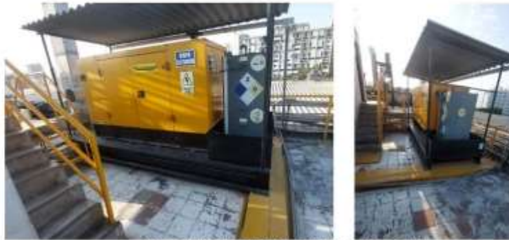
Imagen referencial de equipamiento actual

Se solicita que las propuestas técnicas precisen el peso individual del equipamiento, soportes y todos accesorios que serán utilizados en la instalación.