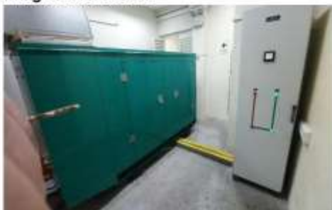
DISPOSICIÓN ACTUAL DE EQUIPO DE 125KW EXISTENTE (Largo: 298.50cm, ancho: 102.50cm, altura: 182.50cm)