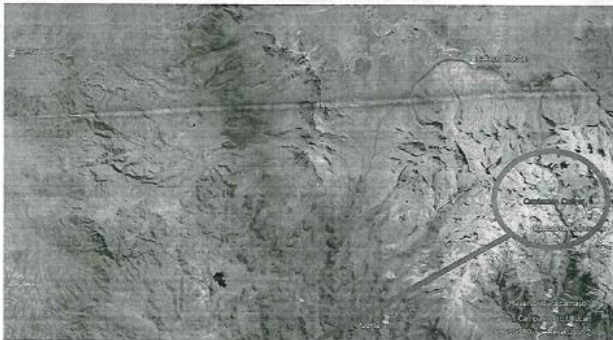
ZONA DE ULLUCAN (COORDENADAS -16.609525, -71.037905)